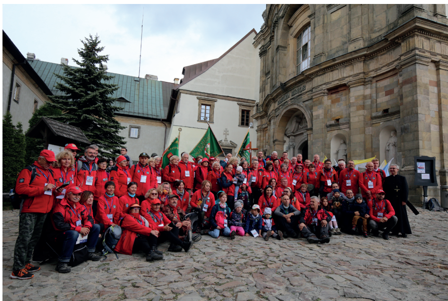
Projekt graficzny regulaminu: Wiktor Idzik - Wydawnictwo „Jedność”. Projekt tła okładki: Marek Jakóbkiewicz. Projekt odznaki rajdowej: Tomasz Rogaliński, opracowanie graficzne odznaki rajdowej: Sebastian Wróblewski.